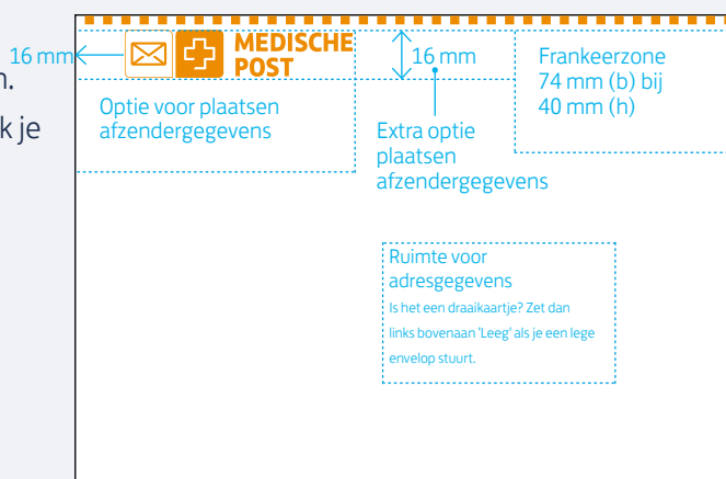
Werktekening met afmetingen

Let op: bij het versturen naar een antwoordnummer is een medische FIM-code verplicht.